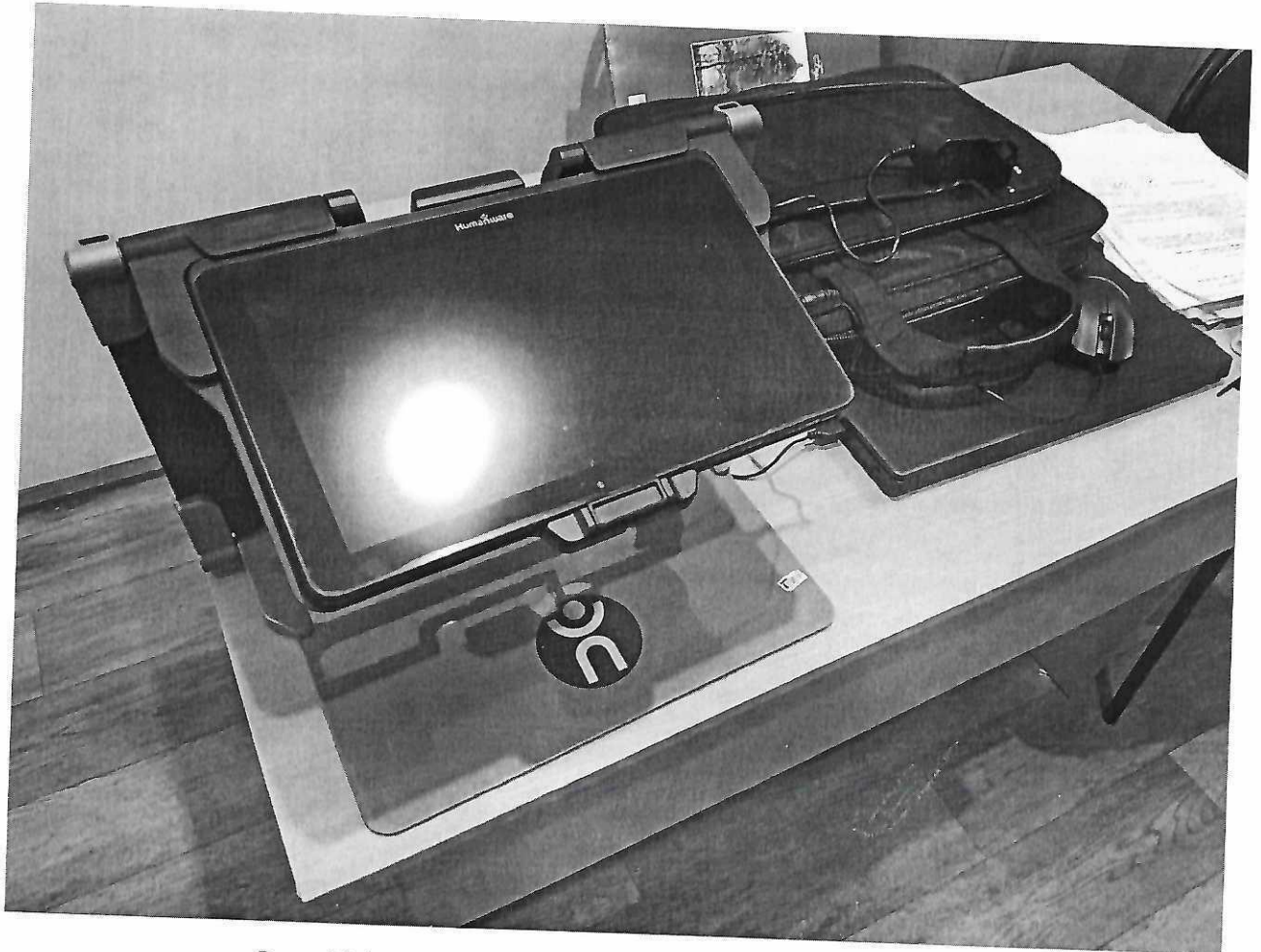
Фото №1. Видеоувеличитель портативный Connect12.

Приложение к акту выполненных работ по адаптации объекта и повышению уровня доступности образования для людей с инвалидностью и маломобильным группам населения (МГН) в период с 2018 по 2022 годы к паспорту доступности ОСИ № 93 от 07.08.2018 года